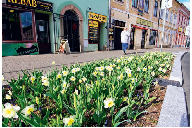
Narcisky na Masarykově náměstí

A co žluté a fialové krokusy na hmyzích záhonech před budovou spořitelny? Viděli? Neviděli? Chyba, chyba, ale nevádí, pamatovat, sledovat, záhony budou v kvetení pokračovat trvalkami, jsou plné překvapení nejen pro pilné včelky.