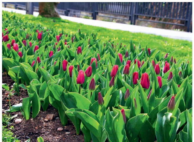
Tulipány u Divadla Karla Pippicha