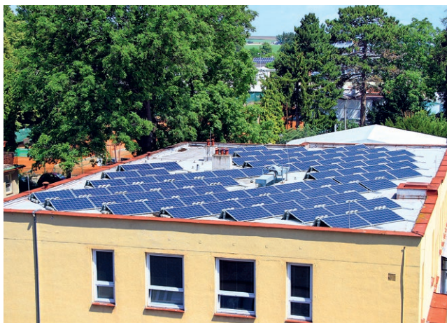
První fotovoltaickou výrobu si město ozkoušelo na střeše budovy Odboru sociálních věcí, Pardubická ul. čp. 53

kterého jsou hrazeny další investice v oblasti udržitelné energetiky s cílem dosažení nových úspor či generování dodatečných příjmů města. Důležitou je také patřičná motivace organizací, aby se samy svými silami snažily o úspory energií. Z uspořených prostředků jde proto 35 % příslušné organizaci, 20 % městu a 45 % směřuje do zmíněného fondu.