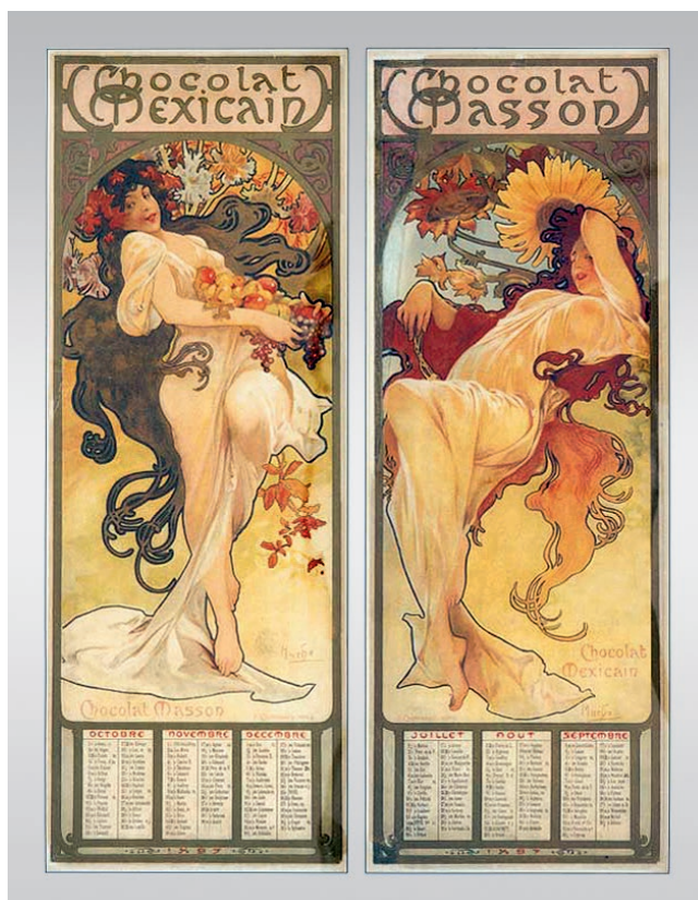
Fragmenty kalendářů A. Muchy ze sbírek Regionálního muzea v Chrudimi

Soubor plakátů malíře A. Muchy nakoupilo muzeum v roce 1898 od nakladatelství Topič u příležitosti výstav v Chrudimi v letech 1897 a 1898, některé plakáty dokoupilo muzeum ještě dodatečně.