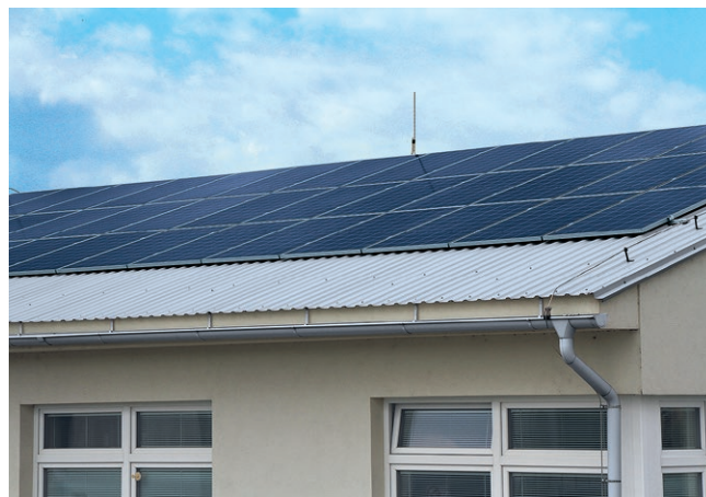
Fotovoltaická výroba elektrické energie slouží i na budově Technických služeb Chrudim

Podobně je to i s elektrickými jističi v budovách města. Probíhají zde kontroly hlavních jističů se snahou o optimalizaci; za slabší jističe jsou nižší distribuční poplatky.