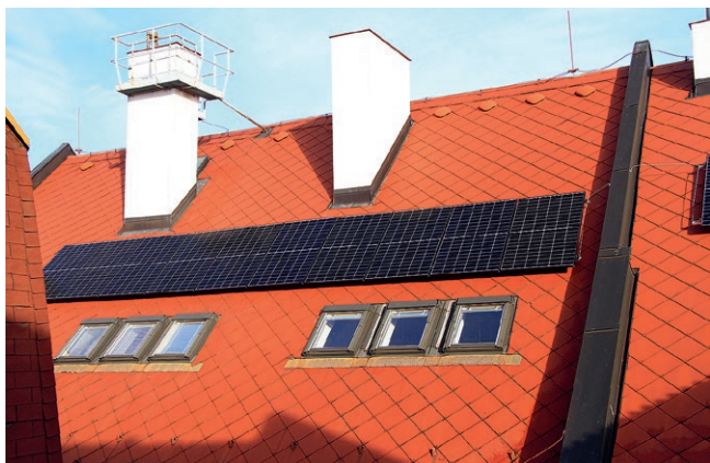
Panely na jihozápadní střeše radnice směřující do dvora, viditelné jsou jen z ptačí perspektivy

V letošním roce se dočkají dvě mateřské školy, MŠ Víta Nejedlého a MŠ U Stadionu. V obou případech pomůže fotovoltaická výroba snižovat především vyšší spotřebu elektrické energie v souvislosti s rekuperací vzduchu.