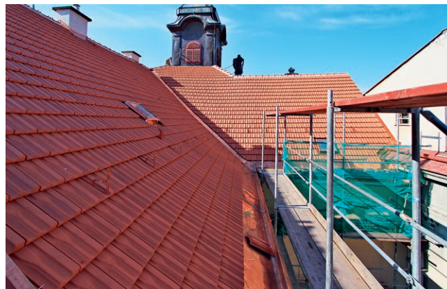
Čerstvě položená střešní krytina na budově Staré radnice

Na budově Staré radnice, chráněné kulturní památce, můžete spatřit nově položenou střešní krytinu. Stylově vhodnější pálená taška „Brněnka“ nahradila hliníkovou krytinu. Následuje výměna prejzové krytiny na římsách štítu a čelní straně budovy.