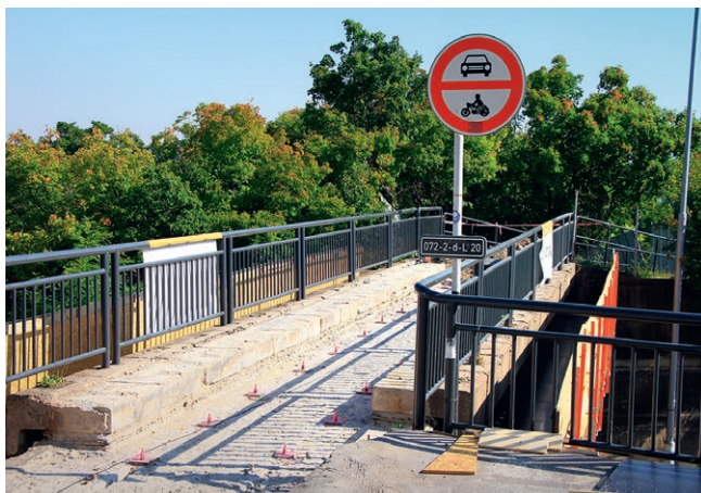
Probíhající rekonstrukce lávky v Moravské ulici

Probíhá Oprava lávky L20 v Moravské ulici pro převedení trasy pro pěší a cyklisty přes vnitřní okruh města, která zahrnuje renovaci nosné konstrukce lávky, úpravy spodní stavby a obnovy opěrných zdí. Oprava konstrukce lávky spočívá v kompletní demontáži mostního příslušenství, tzn. zábradlí, říms, a odstranění vozovky na mostě a na předmostí, dále bude odstraněna izolace a vyrovnávací betonová vrstva nosné konstrukce. Bude provedena oprava a sanace nosné konstrukce i spodní stavby – obnova částí úložných prahů. Stavba bude probíhat do dubna 2023.