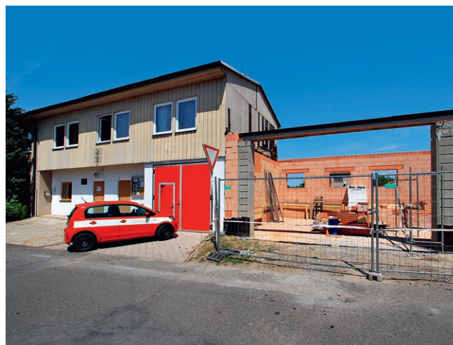
V patře přístavby „hasičárny“ vzniknou univerzální prostory nejen pro potřeby hasičů; kancelář, klubovna, společenská místnost rozšíří možnosti, kde se může odehrávat další život obce

Na objektu MěÚ Chrudim na Pardubické 67 probíhá ve 3. a 4. NP rekonstrukce elektroinstalace. Akce zahrnuje provedení nového přívodu pro jednotlivá patra a následně rozvody po patrech a do kanceláří, osazení nového osvětlení chodeb, nouzového osvětlení, provedení zásuvkových a datových rozvodů v kancelářích a chodbách.