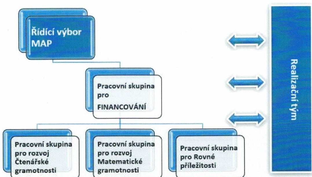
Obrázek 1: Organizační struktura MAP II v ORP Chrudim – schéma

Její grafické znázornění je patrné z obrázku 1: