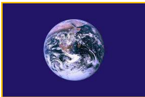
Neoficiální vlajka Dne Země od Johna McConnella

Největší význam Dne země spočívá v tom, že umožňuje i té nejmenší organizaci a jednotlivcům zařadit svůj malý příspěvek k péči o životní prostředí do celostátního a celosvětového kontextu. Den Země umožňuje spojit síly k výraznějšímu oslovení široké veřejnosti i představitelů politické i ekonomické moci ve jménu ochrany přírody a životního prostředí. Každým rokem takto probíhá velké množství akcí, do kterých se stále více zapojují vedle nevládních organizací zejména školy, místní a státní úřady, místní samospráva a velké množství jednotlivců. Dnes slaví Den Země víc jak miliarda lidí ve 193 státech světa. Den Země se tak stal největším sekulárním svátkem, který slaví lidé společně na celé planetě bez ohledu na původ, víru či národnost.