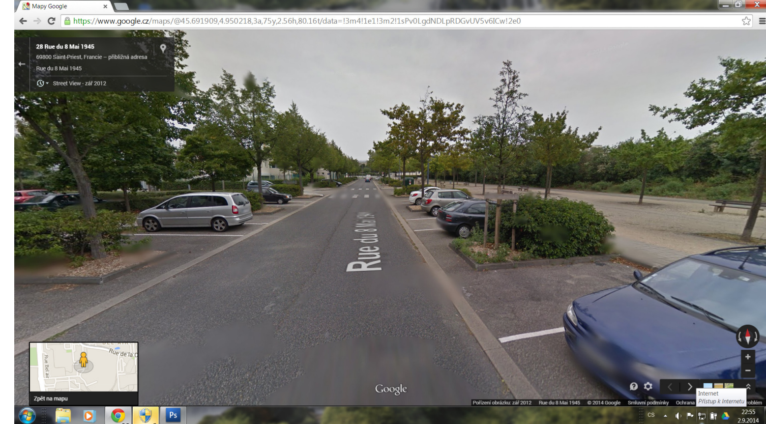
2 OBSLUŽNÁ KOMUNIKACE SE STROMY NA OKRAJI VNITROBLOKU