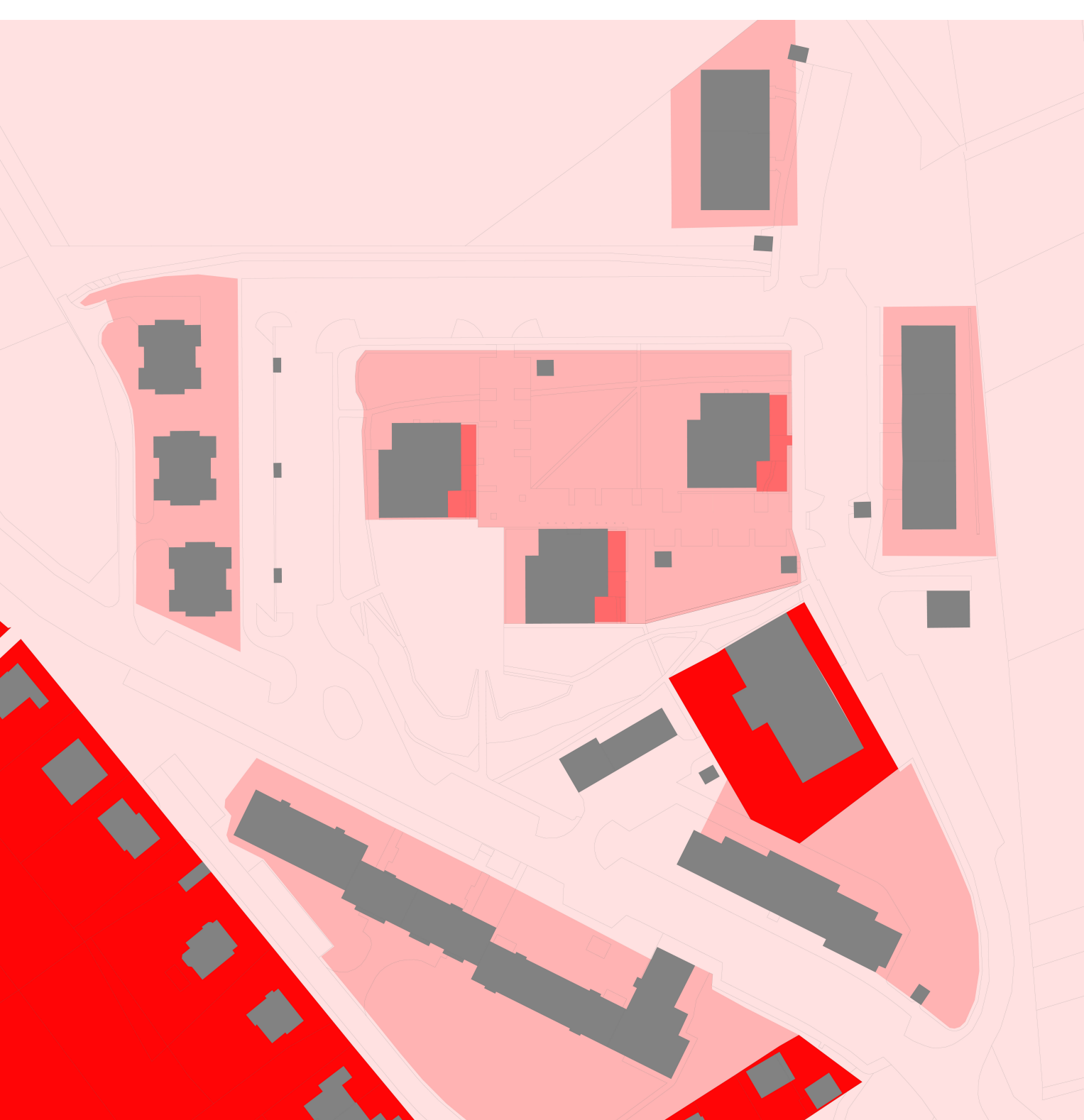
5 PŘEDZAHŘÁDKY JAKO POLOSOUKROMÉ PLOCHY S LAVIČKAMI APOD.

stávající typický sídlištní prostor kolem panelových domů tvořený obslužnými komunikacemi pro příjezd aut k domům s chodníky a travnatou plochou se stromy vytváří volně plynoucí prostor čistě funkčního či technického založení, tento velký, anonymní a neurčitý veřejný prostor je "všude stejný a je všech a nikoho" koncept rozdělení velké veřejné plochy na menší části polosoukromého a poloveřejného charakteru zpřehlední území, zlepší orientaci, nabídne nové obytné prostory s jasnou identitou a může zvýšit zájem jeho uživatelů o "svůj prostor"