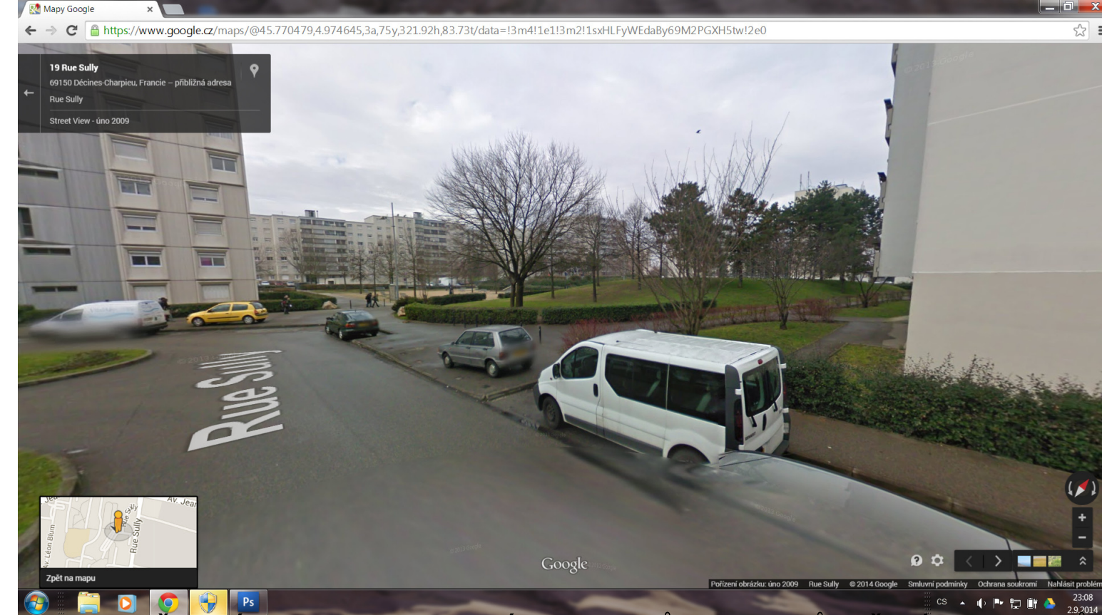
3 ROZDĚLENÍ PLOCHY POMOCÍ POVRCHŮ, STROMŮ A ŽIVÝCH PLOTŮ