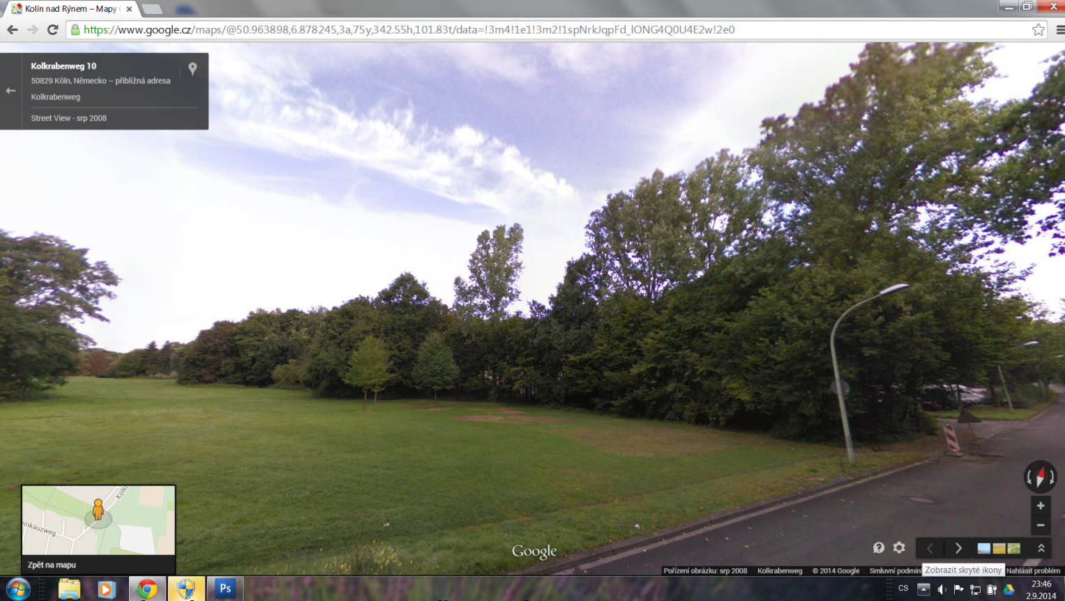
1 ZELENÝ PÁS JAKO PROTIVĚTRNÁ CLONA