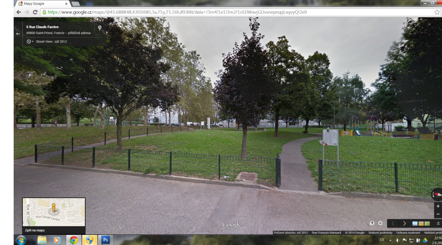
4 ROZDĚLENÍ PLOCHY VNITROBLOKU NÍZKÝMI PLOTY Z PLETIVA