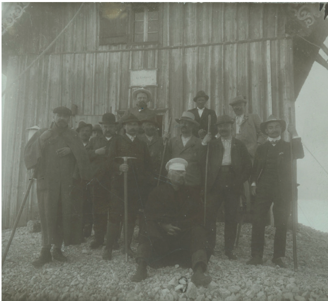
Skupina chrudimských turistů na Sněžce, okolo roku 1900

Iniciativu později převzal Klub českých turistů, jehož chrudimská pobočka byla ustavena v roce 1910.