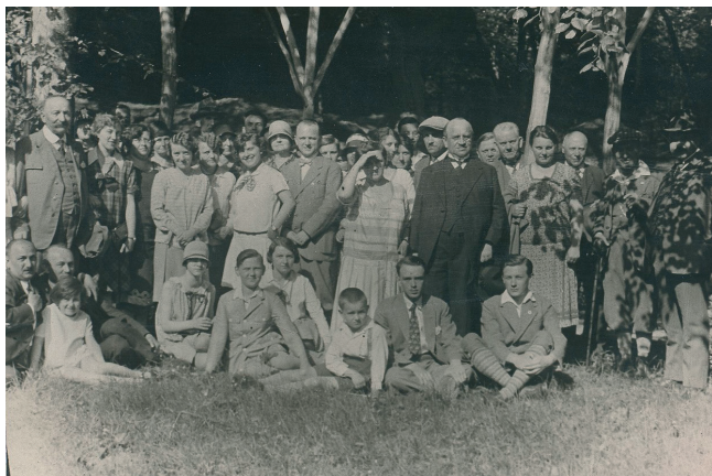
Výlet chrudimského KČT, rok 1930 (Regionální muzeum v Chrudimi)

Počátky chrudimské organizované turistiky připomíná novinový článek. Uvádí se zde, že turistický odbor Měšťanské besedy v Chrudimi se ustavil na jaře roku 1909. Cílem bylo „seznamovati