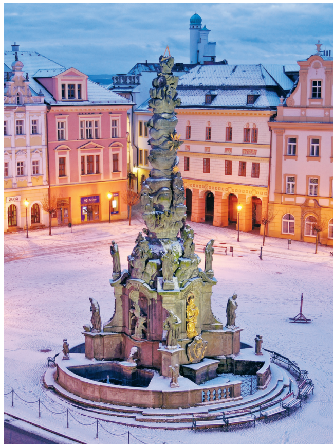
Nejvýznamnější barokní památka Chrudimě: sloup Proměnění Páně

Pavel Panoch (heslo z publikace Chrudim. Vlastivědná encyklopedie, 2018)