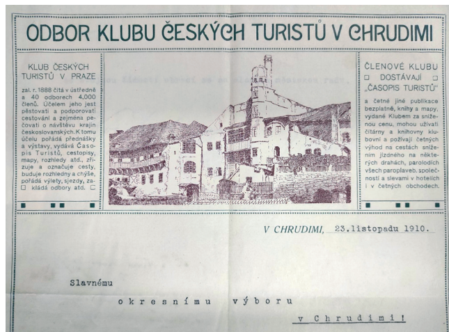
Hlavičkový papír chrudimského odboru Klubu českých turistů (Okresní archiv Chrudim)

V období do vypuknutí 1. světové války se dočítáme o výletech do Touloucových Maštálí, do Tuněchod, o plánovaném výletě na Dářko. Odbor také vydává za poplatek 20 haléřů legitimace na vstup do obory knížete Auersperga. Každý rok bývala valná hromada, plánovaly se výlety, přednášky s promítáním, pracovalo se na šíření povědomí o odboru.