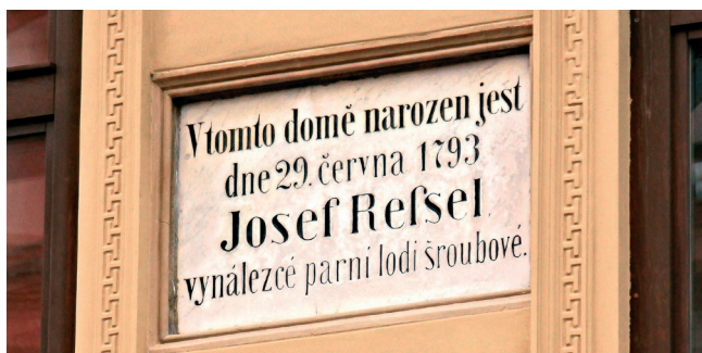
Pamětní deska na rodném domě J. Resslera