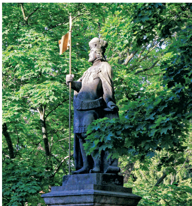
Socha sv. Václava