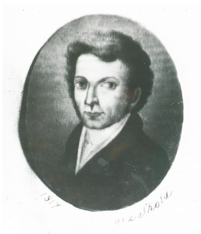
Nejstarší dochovaný portrét J. Ressla od Františka Školy z roku 1817

V tomto příspěvku se nebudeme věnovat ani Resselově vynálezecké činnosti (především vynálezu lodního šroubu) ani jeho studiu na severu rakouské monarchie (v Linci, Českých Budějovicích, Vídni a Mariabrunnu), stejně tak nebudeme sledovat jeho profesní kariéru na jihu monarchie (v Platerjachu, Novo Mestě a Lublani, Motovunu či Terstu a Benátkách) a nebude nás zajímat ani podíl Chrudimě na uchování památky J. Ressla po jeho smrti (výroční oslavy, pamětní deska na rodném domě, pomník, busta v Chrudimském panteonu, spolek RESSEL, gymnázium jeho jména), ale krátce se zmíníme o jeho vztahu k rodnému městu.