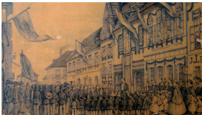
Slavnost odhalení pamětní desky před rodným domem J. Resslera – autor kresby chrudimský malíř a fotograf Eugen Hummel-Bourdon (sbírky Regionálního muzea v Chrudimi)

Dne 29. června 1861 záhy ráno hrála hudba po městě. O půl deváté hodině odebraly se: veškerá školní mládež, spolky živnostenské a setnina ostrostřelců před rodný dům, kdež velký čtverhan utvořily. Ve čtverhanu tom zaujali pak místa svá: hosté, c. k. úřadové, c. k. vojenští důstojníci, duchovenstvo a jiní hodnostáři.