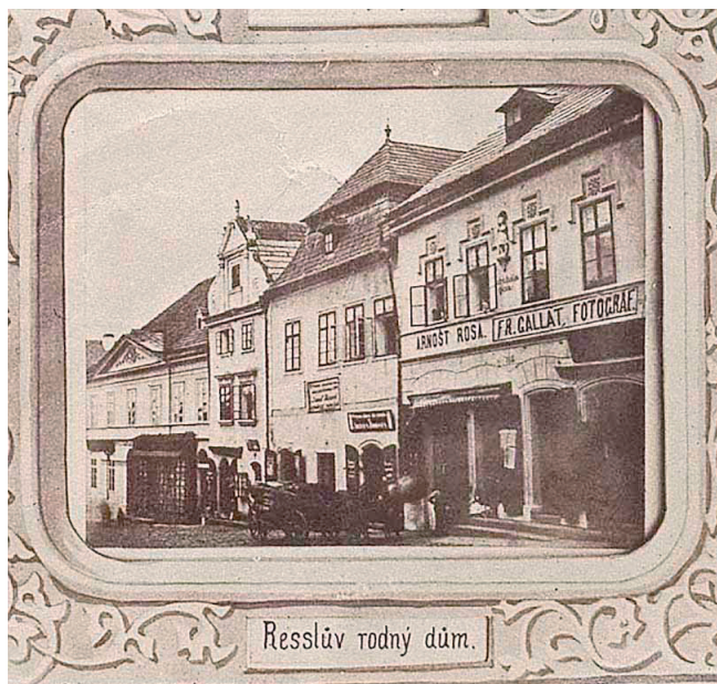
Fotografie rodného domu J. Resslera z alba, které v roce 1875 vydal fotograf František Gallat

mennou pavlač, na kterou vedly venkovní schody, a vížku, opatřenou zvoncem ke svolávání žáků a ohlašování začátku vyučování (k přestavbě a novému vysvěcení budovy došlo při proměně triviální školy na školu hlavní v roce 1847 – rok předtím byla zbořena Žižkova věž, která sloužila škole jako dřevník).