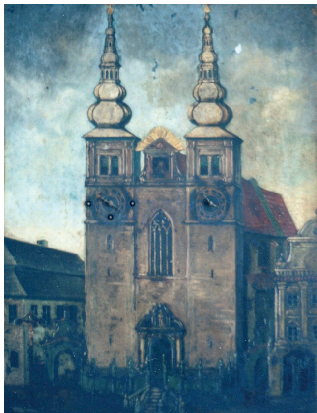
Vyobrazení hlavního chrudimského kostela na přední desce hodin z počátku 19. století (Regionální muzeum v Chrudimě)

Zmiňovaný dům od doby, kdy v něm J. Ressel chodil do školy, změnil samozřejmě také svou podobu. Budova měla tehdy ka-