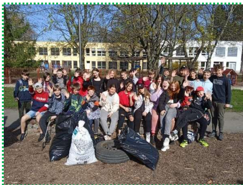
ZŠ Víta Nejedlého