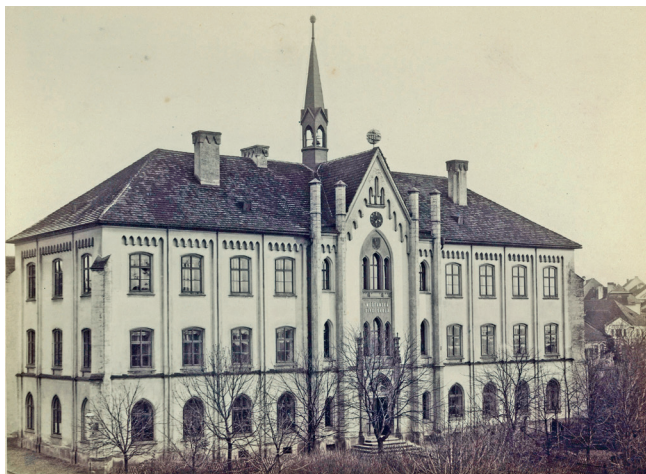
Gymnázium krátce sídlilo i ve školní budově čp. 6. Od roku 1878 zde byla umístěna I. obecná škola dívčí a měšťanská

V roce 1864 se gymnázium stěhuje do samostatné budovy, kterou dala postavit obec podle plánů Františka Schmoranze za kostelem v sousedství hlavní školy (dnešní ZŠ Školní náměstí zvaná „Růžovka“). V roce 1871 došlo k postátnění školy a jejímu rozšíření na vyšší gymnázium s osmi třídami, takže se pak gymnázium nazývalo reálné a vyšší. Studenti absolvovali první dva roky společný základ a ve 3. a 4. ročníku se studium rozdělilo na větev reálnou s výukou francouzštiny a gymnaziální s výukou řečtiny, odkud studenti postupovali do vyšších tříd studia. V roce 1875 proběhly první maturitní zkoušky, maturovalo se z osmi předmětů. Studium úspěšně zakončilo 16 abiturientů.