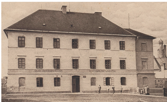
Tzv. stará či hlavní škola čp. 57 v dnešní Komenského ulici

Dne 6. 10. 1863 bylo slavnostně otevřeno nižší reálné gymnázium v budově hlavní školy čp. 57 (dnešní Komunitní dům v Komenského ulici), mělo 107 studentů a náklady na provoz byly hrazeny z prostředků města.