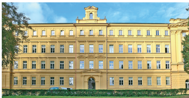
160. výročí založení gymnázia již zastihlo budovu s opravenou fasádou

V roce 2000 budova v Olbrachtově ulici přešla z majetku Kongregace školských sester III. řádu svatého Františka do vlastnictví státu. Od roku 2001 se gymnázium přestalo o budovu dělit se základní školou. Zřizovatelem školy se stal Pardubický kraj, a tudíž se mohlo začít s tolik potřebnými opravami budovy, rekonstrukcí a modernizací interiéru.