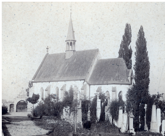
Fotografie hřbitova z přelomu 80. a 90. let 19. století.