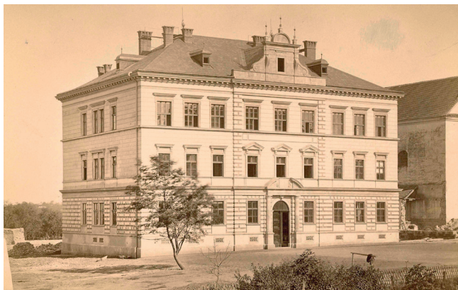
Někdejší dřevařská škola, dnes ZŠ Školní náměstí

V roce 1959 došlo k poslednímu pátému přemístění školy, tentokrát do budovy bývalého pedagoga poblíž vlakového a autobusového nádraží. Četné problémy však vyplynuly z toho, že rozsáhlá budova přešla do majetku základní školy. Od roku 1960 byla organizačním řádem a od roku 1963 i fakticky škola druhého cyklu oddělena od ZDŠ a dostala název všeobecně vzdělávací. V ní se uplatňují pokusné varianty s matematicko-fyzikálním a chemiko-biologickým zaměřením. Pokračuje strojírenská, zemědělská a textilní výrobní praxe žáků. O dva roky později je zavedena humanitní specializace. Probíhá i dvouletý vojenský kurz pro přípravu vojáků z povolání k externí maturitní zkoušce.