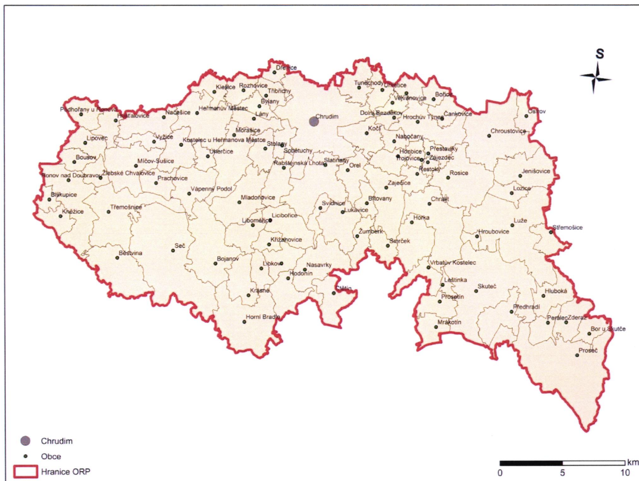
Obrázek 1 Území ORP Chrudim