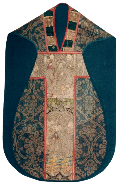
Kasule z Kočí, pektorální (přední) strana

Výšivka je vkomponována do hedvábného damašku se vzorem granátového jablka. Tkanina má původ v severní Itálii v 2. polovině 15., popřípadě začátku 16. století. Látku však byla sešívána z menších částí, takže jde zde o druhotné použití. Výšivka barevnou hedvábnou a lněnou přízí a vlákny a stříbrnou a zlacenou dracounovou přízí je provedena převážně kladeným stehem.