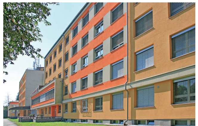
Stávající sídlo školy, v popředí domov mládeže

Po roce 1945 a po skončení druhé světové války se Pardubice staly vysokoškolským městem. Vznikla naléhavá potřeba školských prostor a průmyslová škola přišla o svoji původní budovu. V Pardubicích zůstala elektrotechnická část školy a strojaři byli přesunuti do Chrudimi. Druhým důvodem k rozdělení školy bylo