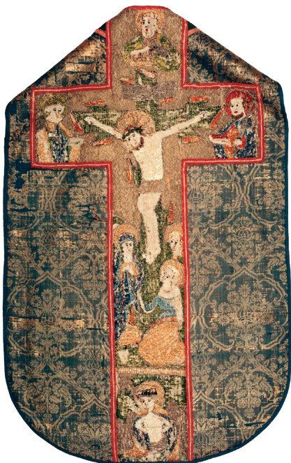
Kasule z Kočí, dorsální (zadní) strana

Nesporně nejzajímavějším a zároveň nejstarším předmětem naší sbírky je kasule z kostela sv. Bartoloměje v Kočí s pozdně gotickou výšivkou, kterou si podrobněji popíšeme. Byla zapsána jako „dříve v kostele kočském, pak v kapli gymnasijní“ a do muzea byla získána od ředitelství chrudimského gymnázia v 90. letech 19. století.