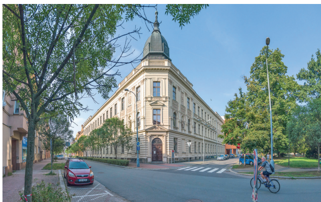
Nároží náměstí Čs. legií a Štefánikovy ul. v Pardubicích

Vraťme se ale do Pardubic v roce 1899. Na počátku byla potřeba vychovat pracovníky pro bouřlivě se rozvíjející pardubický průmysl v posledním desetiletí 19. století. Jednání mezi městem a státem, tehdy rakousko-uherskou monarchií, vyústila v pověření pražského architekta a stavebního rady Jindřicha Fialky založením školy v Pardubicích. Stavitel Fialka školu vytvořil nejen organizačně, ale sám navrhl a vyprojektoval i její reprezentativní budovu, dodnes sloužící školským účelům. Budova se nachází na rohu náměstí Čs. legií a ulice Štefánikovy, v pardubickém městském obvodu I. Škola, původně odborně zaměřená na strojnictví a stavebnictví, zahájila vyučování 1. října 1899. Mezi jejími pedagogy se tehdy objevil například později světoznámý architekt Jan Letzel – autor budovy v japonské Hirošimě, dnes známé jako „atomový dóm“. Mezi absolventy byl také pardubický architekt Karel Řepa. V pozdější době, v oboru strojnictví, po vzniku Československa v roce 1918, absolvoval budoucí letecký konstruktér Zdeněk Rublič, dále významní konstruktéři motocyklů Jawa Josef Jozif a Jan Křivka. Ve dvacátých letech minulého století se totiž škola zaměřila především na strojní obory a ve třicátých letech se vyprofiloval i obor letecký. Není tedy překvapivé, že mezi československými letci, kteří položili život ve druhé světové válce, byli i tři absolventi pardubické průmyslovky, jmenovitě Stanislav Fejfar,