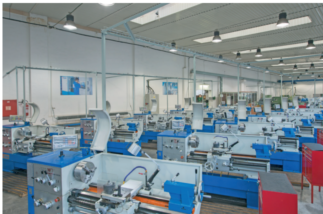
Dílňa oboru Obráběč kovů v areálu tzv. „staré Transporty“ v Čáslavské ul.

příprava stavby jednoznačně určila, že areál bude stát v bývalých Vaňkových školkách, v současné Čáslavské ulici. Po dlouhé přípravě následovala i dlouhá stavba, provázená změnami a odklady. Stavba prováděná Pozemními stavbami Pardubice byla zahájena v prosinci 1967, ale úplně dokončena byla až v roce 1975. Nicméně škola, zvyklá na stísněné podmínky, působila v novém nedokončeném areálu již od září 1974. Tedy právě půlstoletí... Přes tyto nepříznivé okolnosti absolvovalo za prvních 25 let v Chrudimi několik tisíc absolventů, kteří významně posunuli technickou práci nejen na úrovni regionální. Za všechny jmenujme například prof. Jiřího Formánka, významného pedagoga Univerzity Karlovy v oboru částicové fyziky, nebo doc. Vladimíra Andrlíka z ČVUT Praha. Mnoho absolventů školy působilo ve strojírenských podnicích regionu a reprezentovali svou prací české strojírenství i na vzdálených kontinentech. Po roce 1989 se někteří stali zakladateli nových strojírenských firem.