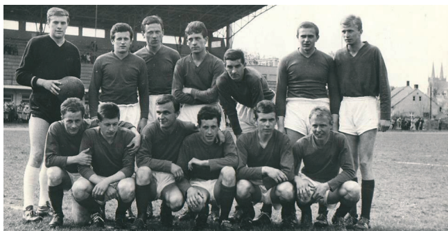
Fotbalisté TJ Elite Chrudim před přátelským utkáním s městským rivalem Transportou na stadionu Emila Zátopka v roce 1964