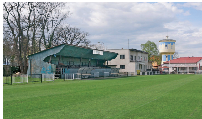
Někdejší tribuna stadionu v Novoměstské ulici