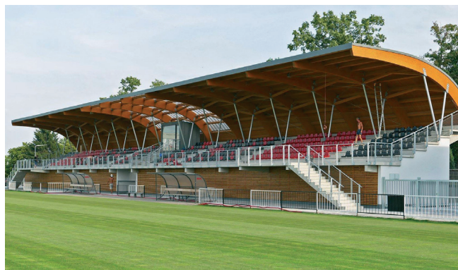
Nová tribuna Městského stadionu, někdejšího stadionu Za Vodojemem, dokončená roku 2015.

Sportovní kluby města Chrudim byly spolkem, který spojoval cyklisty, bruslaře a později hokejisty, tenisty a fotbalisty. První oficiální zmínka o fotbalovém utkání se datuje k červenci roku 1899, kdy klub chrudimských cyklistů sehrál fotbalové utkání s pražskou Slavií. Od tohoto data se v Chrudimi rozvíjel a hrál fotbal. V Chrudimi ale byla po dlouhá desetiletí dvě fotbalová mužstva s vlastní historií a rivalita mezi nimi by se dala bez nadsázky přirovnat k rivalitě „pražských S“. Jedním z těchto dvou klubů byl AFK Chrudim (Atleticko-fotbalový klub Chrudim), dříve známý pod názvy TJ Spartak Chrudim (Tělovýchovná jednota Spartak Chrudim), TJ Transporta Chrudim, TJ Spartak Transporta Chrudim a opět AFK Chrudim.