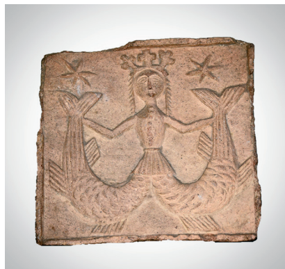
Komorový kachel z Chrudimi s vyobrazením mořské víly Meluzíny.