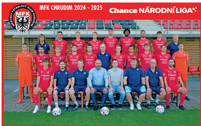
Poslední týmová fotografie

hužel se narazilo na chybějící infrastrukturu, kde fotbalové stadiony nesplňovaly podmínky k udělení licence pro profesionální kluby, a tak na místo Chrudimi postoupily druhé Pardubice. Bylo tedy nutností dobudovat zázemí, aby při případném dalším sportovním úspěchu nebyla tato chybějící nebo nedostatečná část překážkou. Se zástupci města a jejich přispěním se infrastruktura počala budovat.