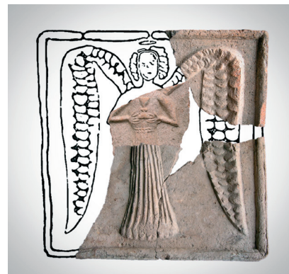
Kachlové zlomky s motivem anděla s kalichem pocházející z období husitských válek.