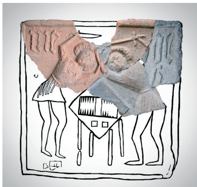
Kachlový zlomek s výzdobným motivem hráčů vrhcábů (hrnčič Jan Medek).