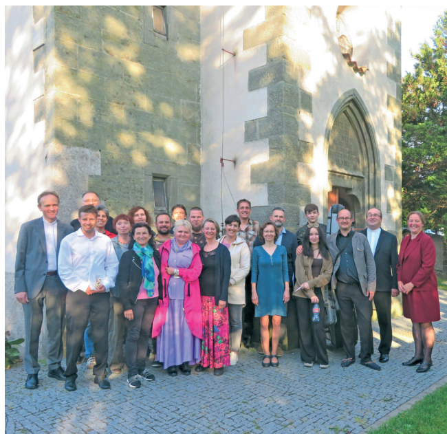
Pouť v Pouchobradech