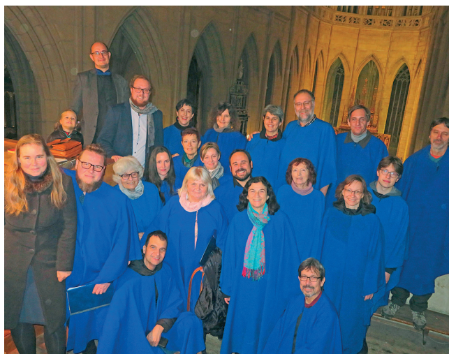
V chrámu v Kutné Hoře, 2024

Za dobu své existence sbor svým zpěvem doprovodil přes 500 akcí. Pravidelně společně s chrámovým sborem doprovází liturgii při bohoslužbách v hlavním chrudimském kostele během celého církevního roku. Zpívané mše svaté tak můžete slyšet o Vánocích, při bohoslužbě na Popeleční středě na počátku postního období, při Velikonočním triduu a Slavnosti Zmrtvýchvstání Páně, také o Slavnosti Soslání Ducha Svatého a při srpnové Salvátorské pouti. Zpěv z kůru arciděkanského chrámu také zaznívá o posvěcení, které v hlavním chrudimském kostele slavíme poslední neděli v říjnu, dále o „Dušičkách“ 2. listopadu a též při Slavnosti Krista Krále, která připadá na poslední neděli liturgického roku, tedy konec listopadu, před začátkem adventní doby. Sbor Salvátor se také každoročně účastní poutních bohoslužeb v okolních obcích. Např. v Sobětuchách při pouti k Nejsvětější Trojici (květen/červen) nebo v Kočí při pouti ke sv. Bartoloměji (konec srpna). Sbor také příležitostně putuje i za hranice své domovské farnosti. Salvátor takto již doprovodil poutní bohoslužby např. v kostele