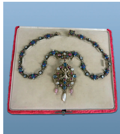
Náhrdelník, Jan Rechner, Praha, 90. léta 19. století