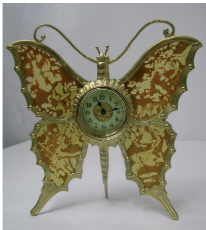
Stolní hodiny ve tvaru motýla, začátek 20. století