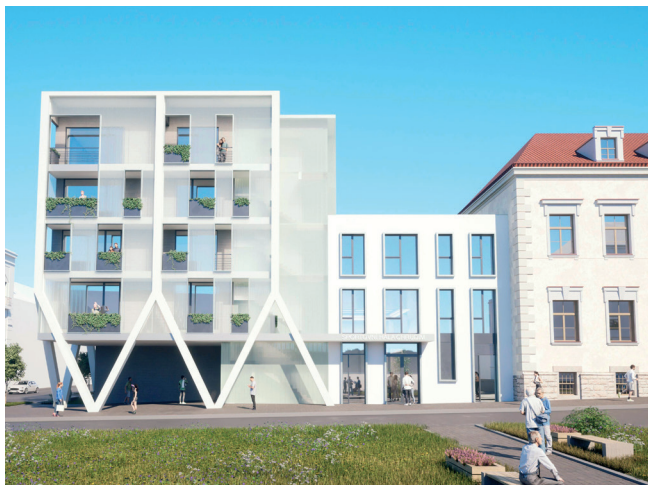
Vizualizace ze studie II. a III. etapy přístavby a rekonstrukce sportovní haly. Prostranství před halou se od vizualizace může lišit

V roce 2023 byla zpracována studie stavby Přístavba a rekonstrukce sportovní haly Chrudim, II. a III. etapa, na základě které bylo v roce 2024 zahájeno zpracování dalších stupňů projektových dokumentací, v nichž jsou řešeny zejména demolice a výstavba Sporthotelu, malé wellness, vstupní spojovací krček, občerstvení s možností budoucího rozšíření na restaurační provoz, tělocvična pro stolní tenis vč. zázemí, skupinové ubytování na půdě Tyršova domu, celková rekonstrukce Tyršova domu, přístavba parkovacího domu směrem ke Sladkovského ulici s venkovním hřištěm umístěným na střeše, které bude přístupné z Michalského parku a navazující venkovní plochy, vč. krátkodobého parkování v Opletalově ulici. Práce na projektové dokumentaci ve stupni pro provedení stavby a výběr zhotovitele budou dokončeny v roce 2025.