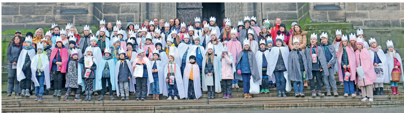
Tříkrálová sbírka v Chrudimi 2024