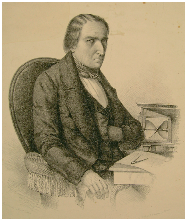
Portrét J. Resslera

Vynálezce lodního šroubu a dalších technických vynálezů a zlepšení Josef Ressel patří k nejvýznamnějším chrudimským rodákům (narodil se 29. června 1793). Jeho styky s rodným městem se však omezily pouze na dobu dětství. Ze svého rodiště odešel ve třinácti letech a nemáme doklad, že by se do Chrudimě znovu vrátil, i když jeho rodiče zde žili asi až do roku 1814. Většinu života strávil J. Ressel v rakouském Přímoří, kde působil jako lesník a jako lesní specialista u rakouského námořnictva. Kromě své úřední činnosti se věnoval četným vynálezům, během svého života však za ně nezískal ani uznání ani hmotné ocenění. Zemřel v Lublani v noci z 9. na 10. října 1857 a teprve po jeho smrti byly uznány jeho zásluhy, především jeho vynález lodního šroubu.