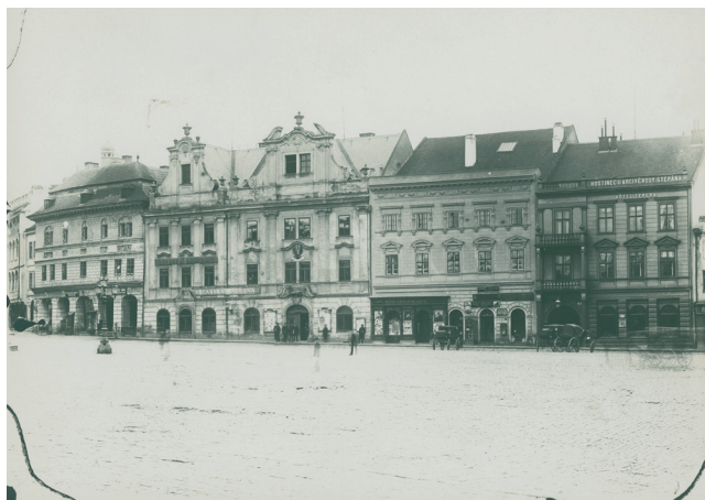
Dnešní Resselovo náměstí