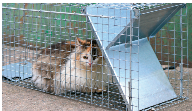
Ve dnech 3.–16. února budou toulavé kočky odchyťávány v lokalitě zahrádkářské kolonie Bělídlo

Město ve spolupráci s Útulkem Chrudim spustilo na jaře minulého roku program kastrací přemnožených toulavých a bezprizorních koček. Program úspěšně probíhal rovněž na podzim a letos se na něj navazuje, a to dokonce v rozšířeném formátu: nově se program vztahuje i na kočky, jež jsou útulkem určeny k adopci. Kočky nabízené k adopci tak již budou, pochopitelně s výjimkou koťat, vykastrované, čímž jejich osvojitelům odpadne jedna velká starost.