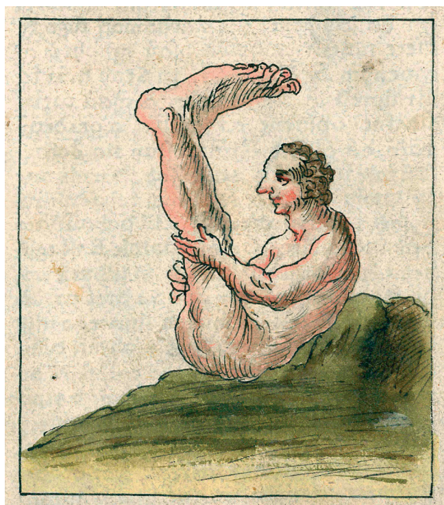
„Kontrfekt lidí jednonohých“ z opisu Mandevillova cestopisu