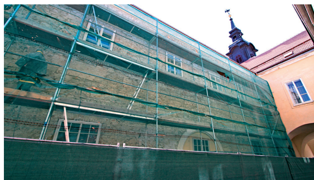
Letos se budova Staré radnice opět zakryje lešením

Probíhá výběrové řízení na veřejnou zakázku Fasáda čp. 1, Resselovo náměstí, etapa ul. Fortenská . Po statickém zajištění objektu a realizaci střešní konstrukce následuje plocha fasády ve Fortenské ulici. Stávající omítky jsou z podstatné části otlučeny. Veškeré zdobné prvky fasády budou zachovány, resp. obnoveny. Pro obnovu omítek budou použity systémy používané pro obnovu kulturních památek. Návrh barevnosti fasády vychází z průzkumu dochované barevnosti. Plocha fasády ve Fortenské ulici bude provedena ve světlé limetkově zelené. Tektonické prvky a plochy průjezdu budou provedeny v lomené bílé. Okna v přízemí budou částečně opravena a částečně nahrazena novými replikami stávajících. Boční vstupní dřevěné dveře budou opraveny. Na akci bylo zažádáno o dotaci z Programu regenerace městských památkových rezervací a městských památkových zón poskytované Ministerstvem kultury České republiky.