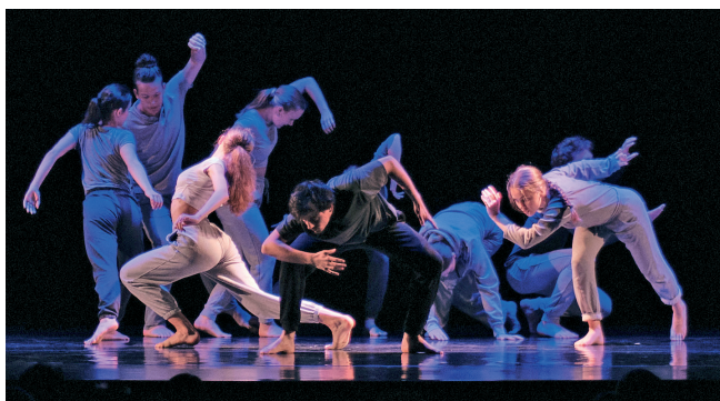
Z vystoupení Pop Baletu

Spolky se představovaly chrudimské veřejnosti především právě tanečními zábavami, v pozvánkách označovanými jako „reprezentační“. Taneční večery a zábavy pořádaly ovšem i příleži-