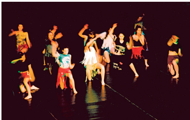
Taneční skupina Flek (Regionální muzeum v Chrudimi)