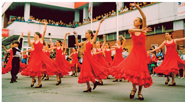
Vystoupení taneční školy Besta Chrudim (Regionální muzeum v Chrudimi)

Tanec má v Chrudimi dlouhou tradici, i když o něm až do 19. století máme jen velmi nedostatečné prameny. Tanec se rozvíjel pomaleji než hudba a trvalo dlouho, než se z prosté zábavy dobral i ke svým vyšším, umělečtějším formám. Svou roli jistě sehrála i dobová, oproti dnešku sešňerovanější morálka. Tanec měl ze své podstaty fyzického prožitku poněkud pikantní příchut' hříchu.