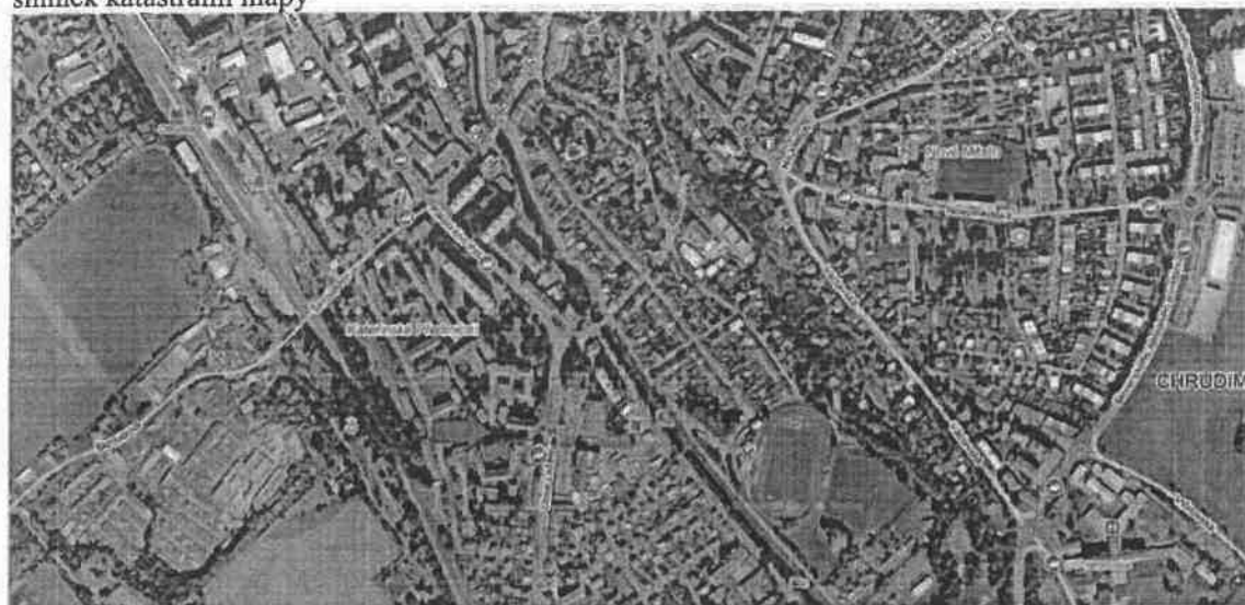
Pozemek p. č. 1465/4 v k. ú. Chrudim snímek katastrální mapy