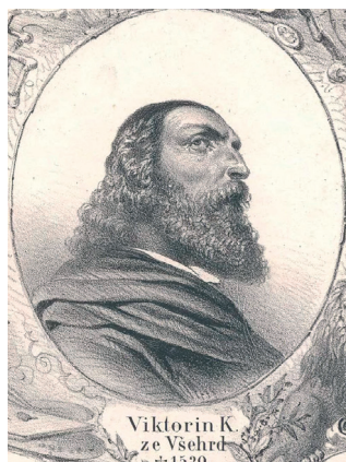
Idealizovaná podobizna Viktorina Kornela ze Všehrd z 19. století

Březen je tradičně spojen s oslavou knih a čtenářství. Knihy nás dokážou přenést do jiných světů, ale zároveň odrážejí ten náš – a kdo by o něm mohl psát lépe než autoři, kteří v něm sami žijí? V následujícím textu proto věnujeme pozornost chrudimským spisovatelům a spisovatelkám a jejich tvorbě.