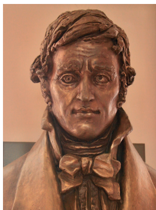
Busta Jana Nepomuka Štěpánka v pantheonu chrudimského Muzea