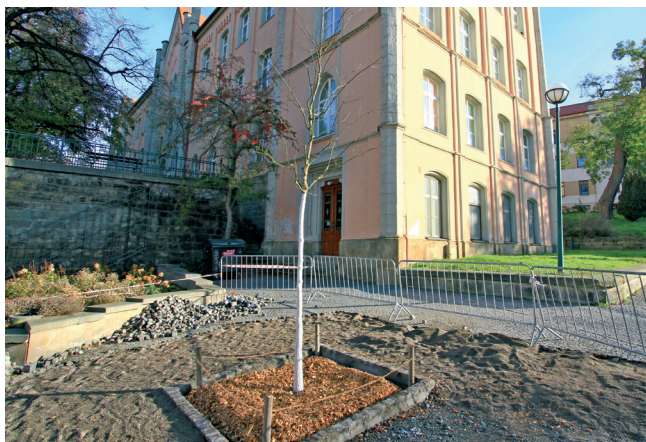
Výsadba stromu na Žižkově náměstí byla jedním z loňských projektů participativního rozpočtu