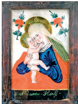
Panna Maria Pomocná, Kladsko (Kaiserwalde), 3. čtvrtina 19. století (LU 842)