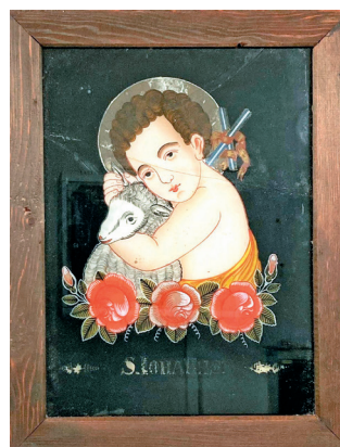
Sv. Jan Křtitel, tzv. jihočeská růže, jihočesko-rakouské pohraničí, přelom 19. a 20. století (LU 868)

Iva Kopecká, Regionální muzeum v Chrudimi