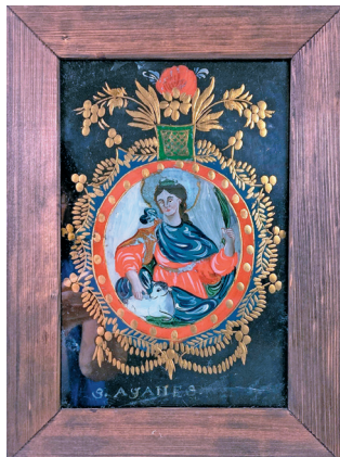
Sv. Anežka, podmalba sklářského typu se zlatým brusem, severní Čechy, 1. třetina 19. století (LU 860)

Obrázky na skle tvoří menší, ale velmi kvalitní kolekci etnografické sbírky Regionálního muzea v Chrudimi, vytvářenou průběžně již od konce 19. století.