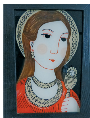
Sv. Barbora, ukázka současné tvorby, autor Alois Macháček, 80.–90. léta 20. století (LU 1186)